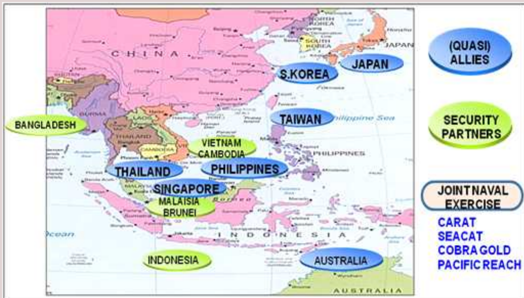
<그림 2> 미국의 동맹국 및 안보 파트너